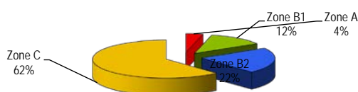
Répartition des PTZ selon la zone du logement (effectifs) dans l'ancien HLM (2% des effectifs)